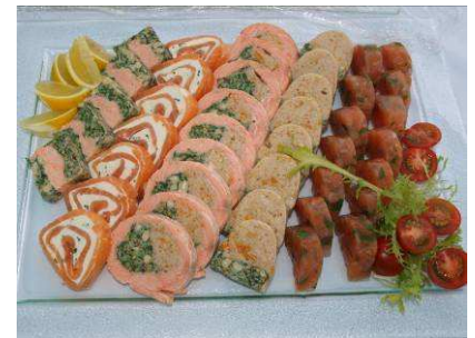
Terinka z marinovaného lososa

Možnost objednávky alkoholických i nealkoholických nápojů, espresso kávy, fresh džusů. V případě Vašeho zájmu – prezentace jídel aktivním kuchařem.