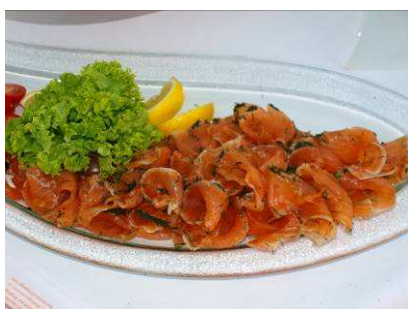
Marinovaný losos Gravad lax