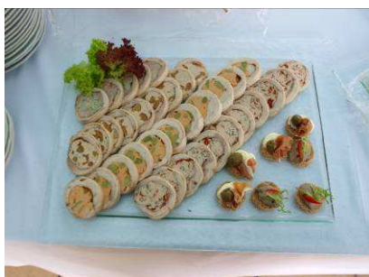
Galantina z kuřátka