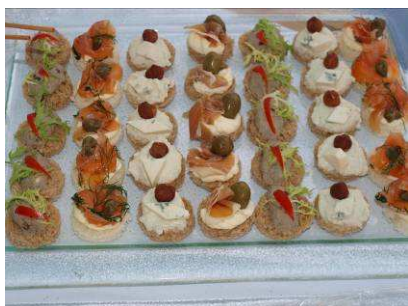
Kanapky – různé druhy