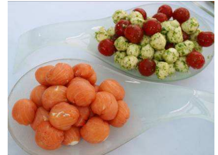
Pralinky z uzeného lososa Salát Caprese